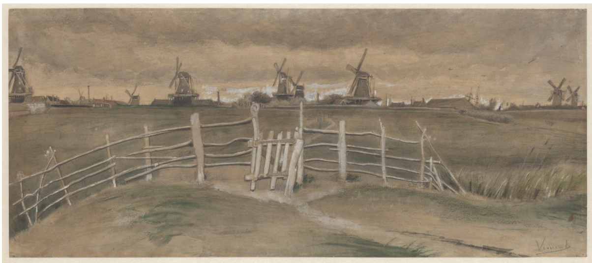
Vincent van Gogh: Väderkvarnar i Dordrecht (Weeskinderendijk) , 1891, Collection Kröller-Müller, Otterlo, Nederländerna.

Den nya samlingsutställningen ur Didrichsens egen samling av modern konst visar bland annat Finlands veterligen enda målning av Mark Rothko från 5.9.2020.